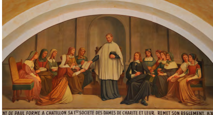
NT DE PAUL FORME A CHATILLON SA 1 RE SOCIETE DES DAMES DE CHARITE ET LEUR. REMET SON REGLEMENT. 8 X

Wir machen Station in Taizé, Paray-le-Monial und Vézelay, Orte gelebter Spiritualität.